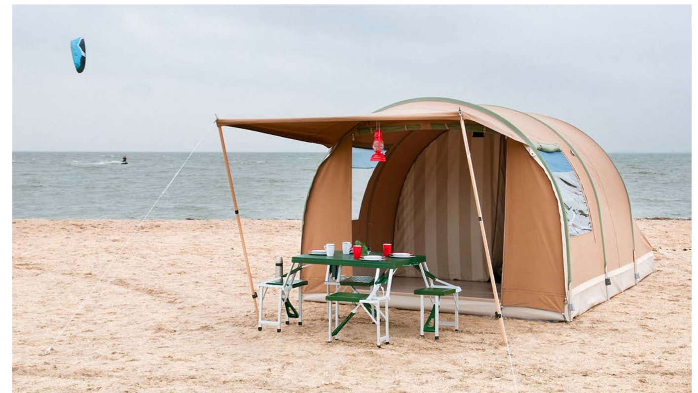
De Karsten tunneltent.

is kostbaar, onnodig gedoe met het opzetten van een tent is zonde van je tijd. De Karsten Tunneltent biedt uitkomst, want die is in