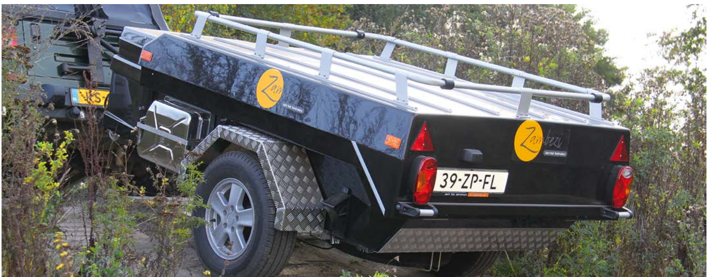
De Zambezi tenttrailer.

Aart Kok Adventure Tenttrailer Import BV www.aartkok.nl