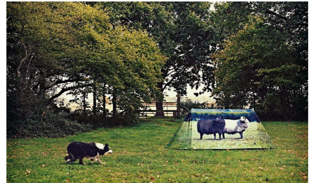
De 'Animal Farm' zet iedereen op het verkeerde been...