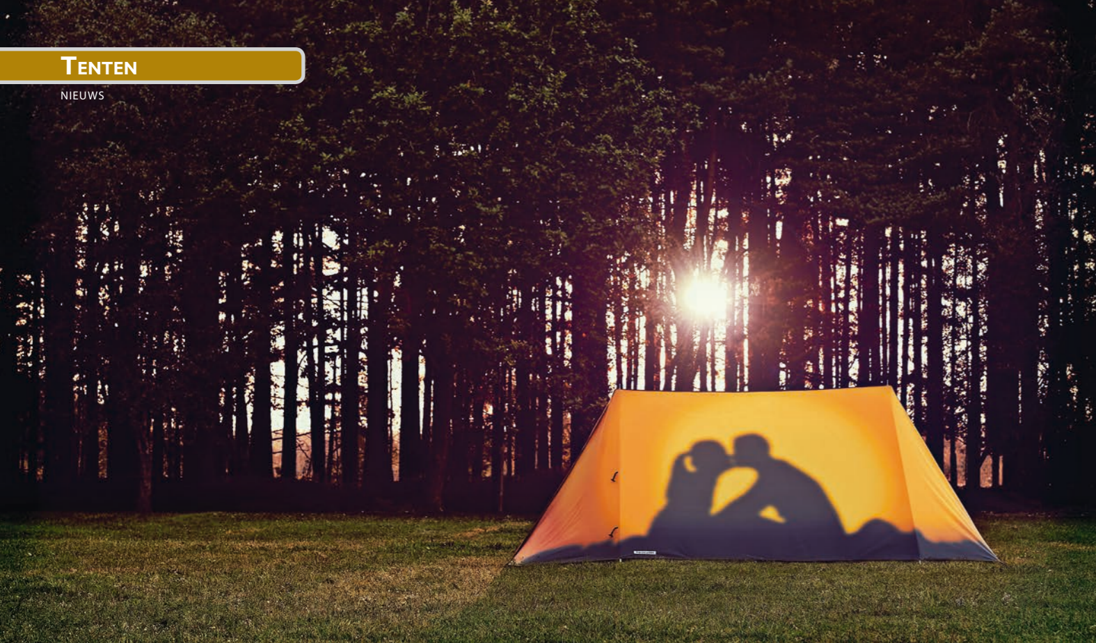
Deze opvallende bedrukking trekt geheid de aandacht op het kampeerterrain.